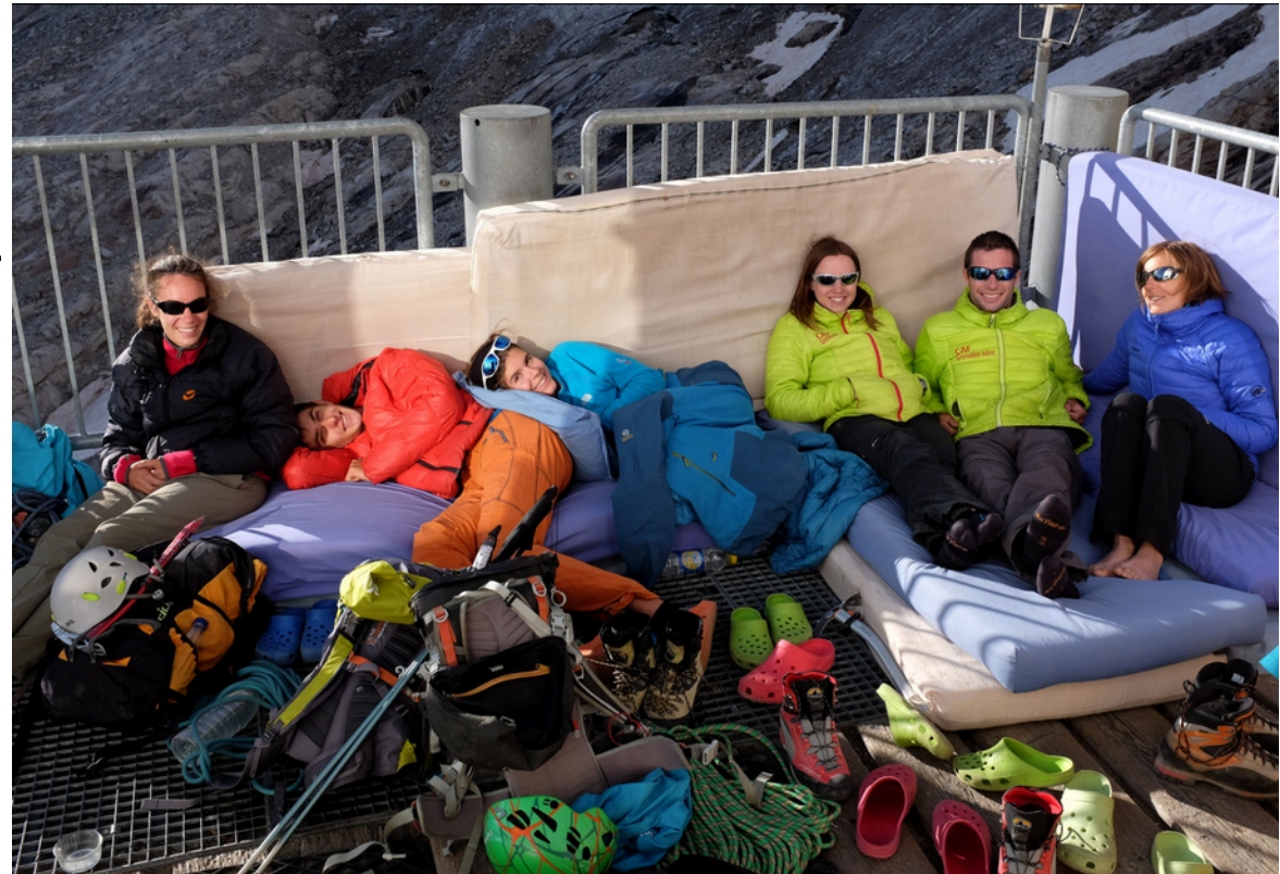
Photo refuge du Promontoire